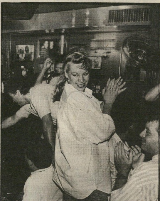
שרים, רוקדים ומחכשים

ובחצות מתחילים החיפושים. עוברים מבר לבר, מפאב לפאב, ומחליטים שהלילה לא הולכים לישון לבד. לילה בלי הפסקה בתל-אביב. (עמוד 26)