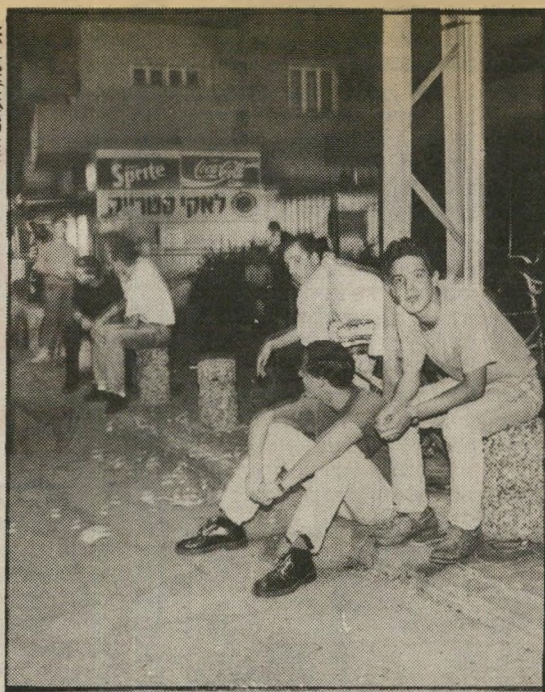
מחכים להסעה בחזרה לחולון