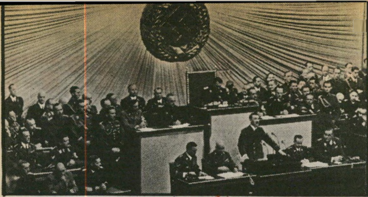
נאום היטלר ב1.9.39

בשנה שעברה סירבה ארצות-הברית להעניק אשרה זו. כתוצאה מכך הועברה עצרת האו"ם לזנוה, במיוחד למען ערפאת. בזנוה