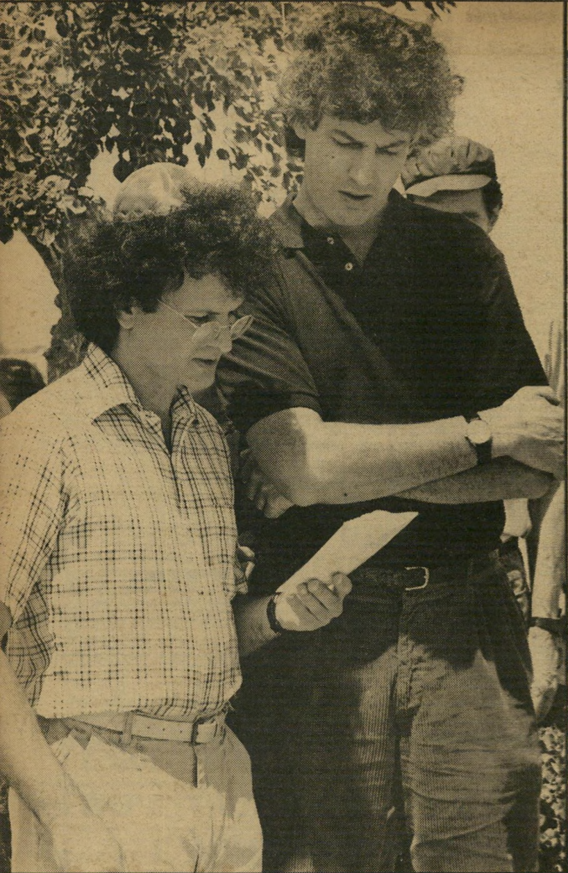
און ויוני תמוז

אף שהטכס הדתי קוצר ככל האפשר, לפי בקשת המישפחה, הרי עצם קיום טכס דתי בהלוויית תמוז מטיל אור על המצב בארץ. בעיני תמוז זה היה נראה בווראי כהשפלה. גופתו העטופה-בטלית טולטלה לאורך השביל אל הקבר, על אלונקה, בלי ארון (מינהג ברברי, אמר אחר הסופרים, שבאו להלווייה), וכך דורדרה לקבר. הבנים אמרו ביחד קדיש בפעם השנייה ליד הקבר. הרב אמר בחיפזון את התפילות המינימליות הדרושות. מרבית הנוכחים — אך לא כלם — חבשו כיפות וכובעים.