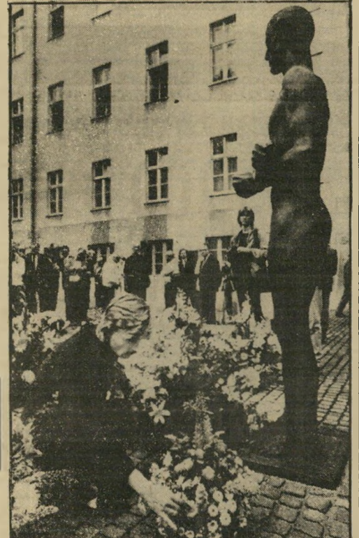
אשה מניחה זו פיתח בוזז בה הוצא להורג ביהודה הקולונל קלאס שטאמברג, מראשי הקשר נגד היטלר. הטקס איז מלאת 45 שנה לנסיון הנגל לחסל את היטלר באמצעות פצצה שהטענה נטק לידו.