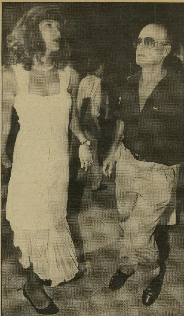
ריקוד מכושף עורך-הדין המפורסם צבי לידסקי, ש"ספרו "כישוף" יצא לאור באחרונה, היה מבין הראשונים שקפצו להראות את כישוריהם הטובים על רחבת-הריקודים. לידסקי היה מלווה בידידו הטוב אמיר שמאי.