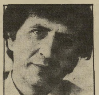
אלקאסב רמי להאמן?