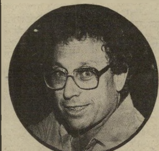
אלמגור איך זכה?

לפעמים נדמה ששיא ה"אינזיות" התל-אביבית, פיסגת האוונגרד המקומי, היא נטילת חלק בפעולות של קבוצות רדיקליות תל-אביביות בצד הימני של האופנוע. ומעניין לראות איך שוכני נרגילה, מתבודדי שניקין ודובריהם בעיתונות התל-אביבית, שנשארו