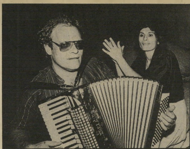
סוכן ביטוח מדנס (במסיבה) מי מרוויח? כמה?