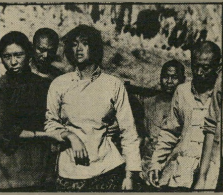
הבעל מת בלילה-הכולות

שדות החיטה האדומים (גרדון, תל-אביב, סין) — זהו הסרט הראשון מסיין העמי-מית המוצג בישראל. מבוא מבטיח ומפתה להמשך, שצריך לקוות כי יבוא. יש בו חיוניות רבה, עוצמה חזותית בלתי-דגילה ורגעים מוטיים יפים, ודב-האהב, שהוענק לו אשתקד בברלין, מוצדק בהחלט. הסרט מתחלק לשלוש חטיבות המובילות אותו בהדרגה מן ההומור המולקוריסטי אל טראגדיית האמיים. קץ של מספר, בעזרתו נשמר מרחק מסו-יים בין הצופה לעלילה, מציג סיפור כפרי על נערה שהוריה העניים מוכרים אותה ליינן מזדקן חולה צרעת, שאותו אין רואים כלל על הבד.