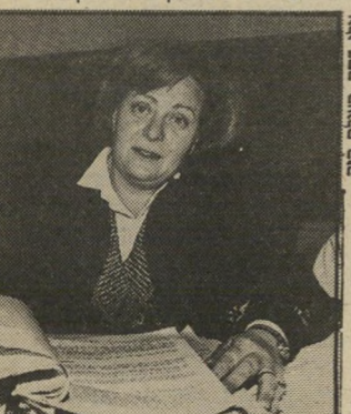
תובעת אמסטרדאם בלעתי כדורים מכל הצבעים...

שלי ואת התרופות שלה. לבשתי רובון ויצאתי לחצר. היום אני יודע שעשיתי טעות. היי-תי צריך לרסס את עצמי לפני שהי-צתתי את הגפרור. אבל ככה זה קרה. אז בלעתי את כל הכדורים מכל הצבעים ומכל הגרלים, ורצתי לבית-החולים מאיר. שם המשכתי לכתוב את המיכתב ומסרתי אותו לאחות.