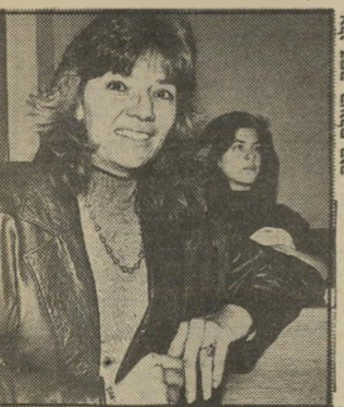
קלינאית-תיקשורת קורנבלאו רציתי להזרק על המוקד...

הנאשם האומלל, שהרגיש כי נעשה לו עוול נורא, פנה לעורך-הדין לוייתן וביקש ממנו לייצגו בעירעור. כאשר נידון העניין בבית-המישפט המחוזי, הסביר עורך-הדין לבית-המישפט את העובדות, ואמר שאליו היה עורך-הדין מופיע לפני בית-המישפט דלמטא, ית-כן שהיה מצליח לזכות את הנאשם כליל. אך לפני הרכב העירעור ביקש הסניגור רק הקלה בעונש. בית-המיש-פט לעירעורים ביטל את הפסילה לצי-