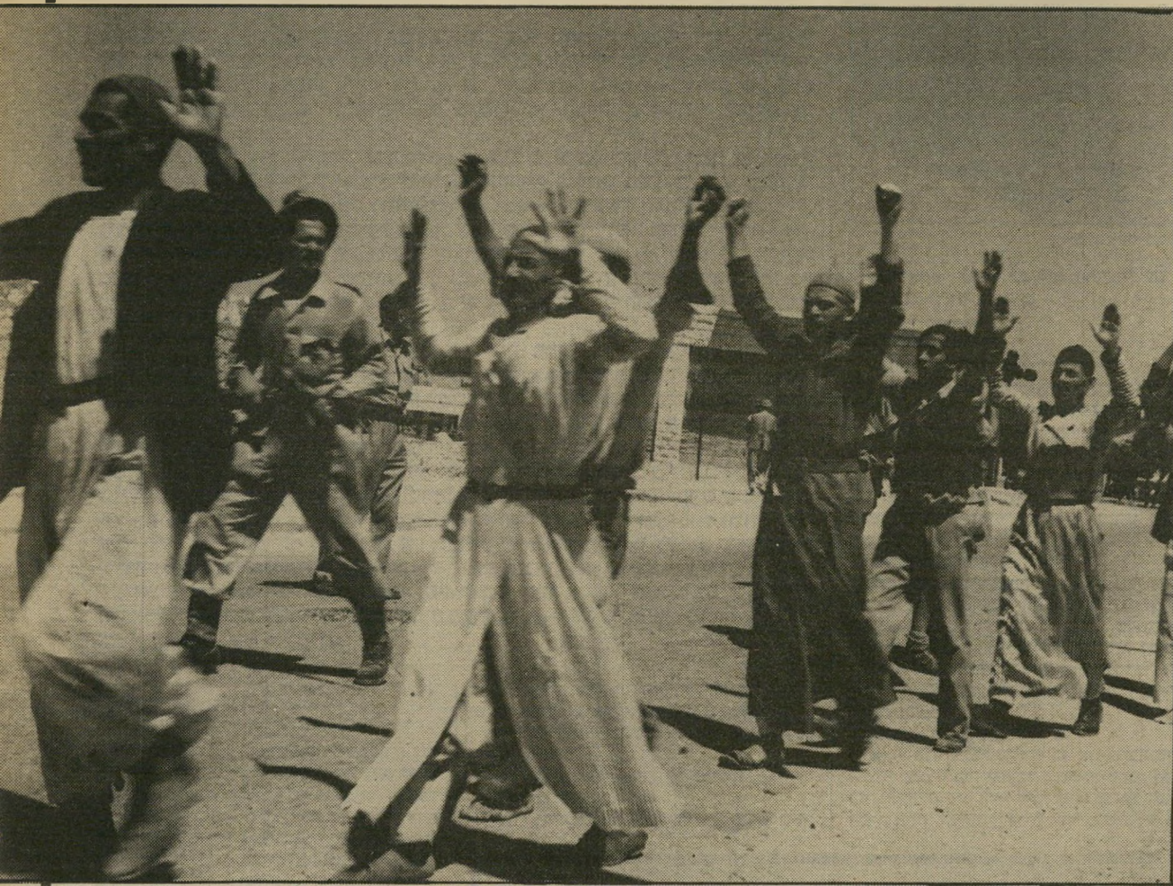
גירוש הערבים מרמלה למחרת הכיבוש אוחו הדבר, אבל בשלבים

היסטוריונים אלה היו כרום אנשי-צבא שוליים בתחום המינצעי, שהועלו לדרגות ככר