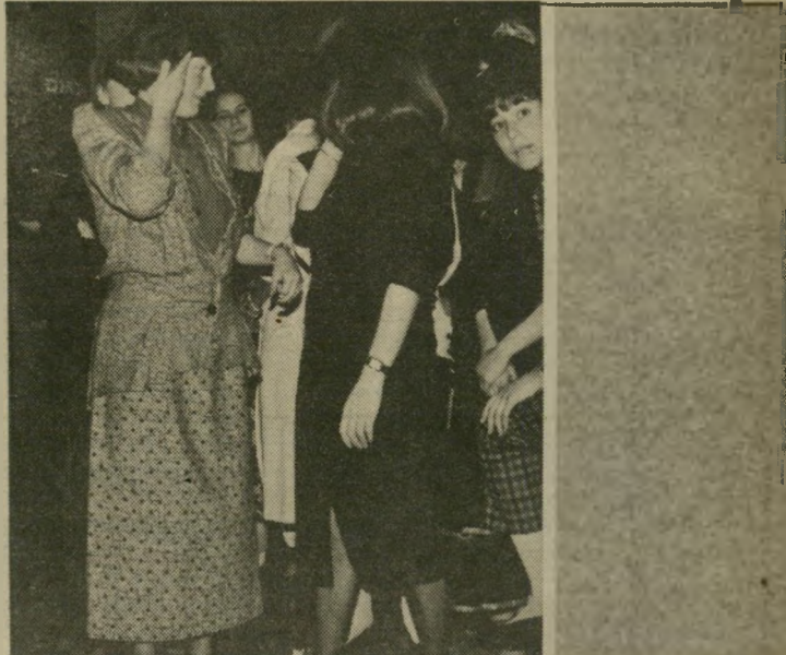
עזרת נשים חלק מהנשים, שהרגישו מקופחות בגלל המחיצה שהמרידה ביניהן לבין הגברים, הצטופפו בפתח הצד, וצמו בשימחה הגדולה בעזרת הגברים, עד שנתבקשו לזוז.