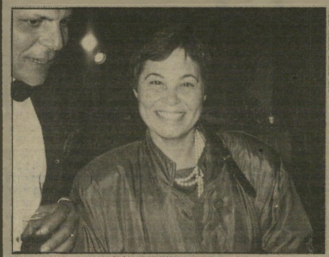
הסדרים שריושנה בירן היא ידעה

והיא ידעה בדיוק מה טומנת לה המחלה בחובה, מהם סיכוייה ואיך יראו ימיה האחרונים.