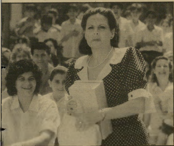
„הקיץ של אביה“ — בקולנוע, כתבתי כדי שלא לצאת מהדעת

● מדור „הקיץ של אביה“ לגי בייך? פיסגת ההצלחה?