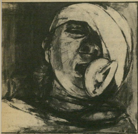
רות שלוש: ילדה עם מוצץ

אולם, הכה נשוב לאותה תוכנית מרתקת, לאוי-תה גברת עדינה. סממן מעניין אחר של אותם ערבי-ריאיונות היא נוכחות הקבע של דמות נרי-ספת העונה לשם מרג'. זוהי אשה זקנה ורתויה היושבת לא הרחק מ"עדינה" ומהה מעין שקי-אימונים, או פחא-אשה, כבורה. בכל ראיין, עם כוכב זה או אחר, עם אנשי מימסד וזונות, ננה