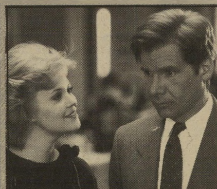
האריסון פורד ומלאני גריפית: מוכשרת למכור אותו כהמצאה פרטית שלה. בקיצור, בארא-קודה אמיתית.

של הסיפור, ועד לאנושיות העמוקה, המסתתרת מתחת למועקה, שבה נתונות רוב הדמויות. הקצב האיטי הוא בלתי-נמנע. הוא חלק מן החוויה של חיי העובדים את האדמה שבהם מטפל הסרט. מאכס פו-סידוב מדהים בתפקיד האב המז-דקן, המנסה לשמור על חזות של כבוד ועל זיק של תיקוה כשהמציאות סופחת באכזריות בפניו, ופלה הוונגארד הצעיר מיטיב לגלם את תפקיד הבן. ה-סרט, שזכה לדקל הזהב בפסטיבל קאן, מבטיח בסיגנון הריאליזם הרומאנטי והוא מצטיין בכך.