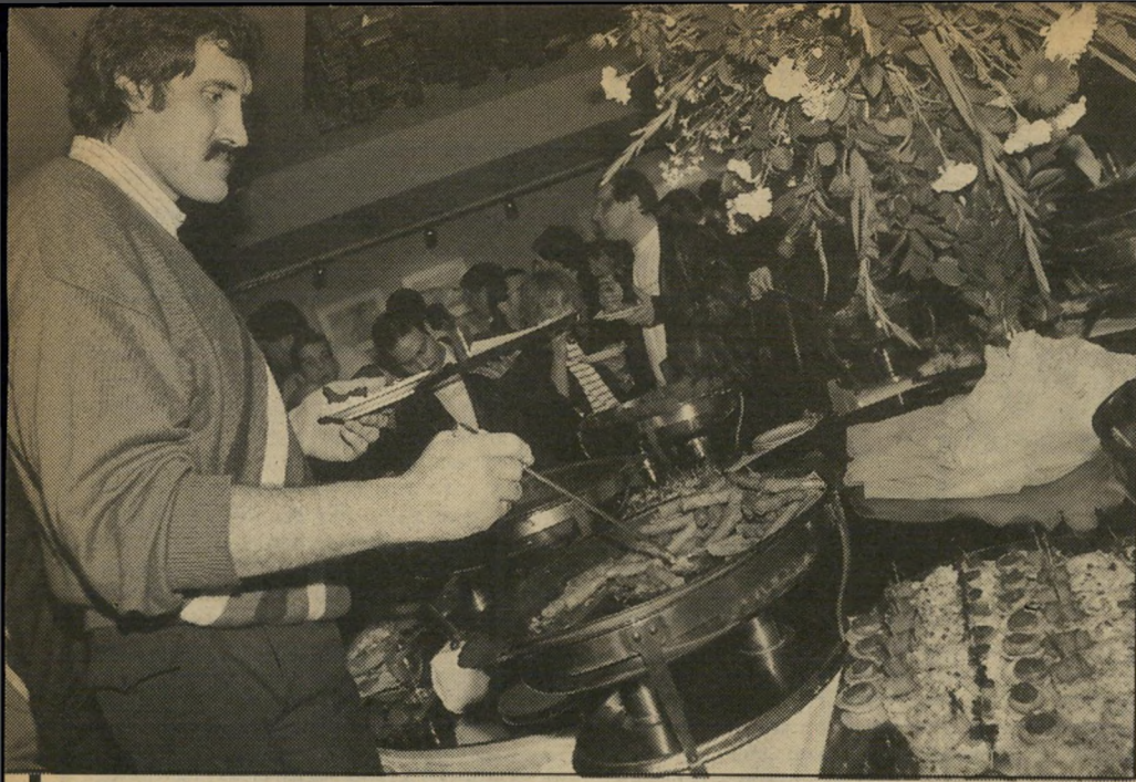
הוא מסוגל לחסל. השחקן הענק גילה שהוא מתעייף מהר בגלל המישקל האדיר שלו, המעמס על עמוד-השידרה ומשום העובדה שכבר אינו צעיר ביותר.