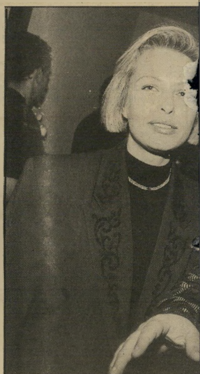
מאז פרשת הקוקאין שהם היו מעורבים בה, עלה באחרונה במישקלו, ואשתו היו במצב-דומם חברים שאיתם לא התראו זמן רב.