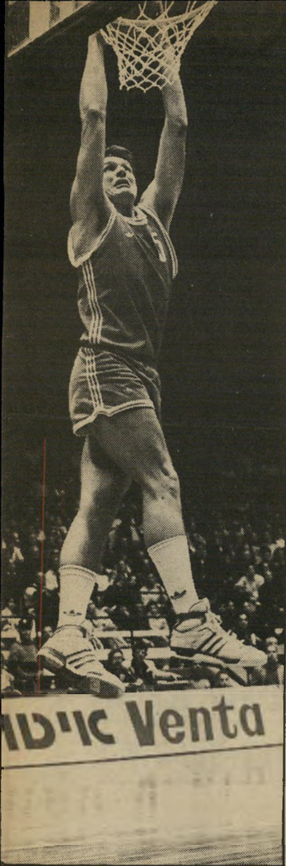
מרחף ברז'נוי נתלה על הסל אחרי הטבעת הכדור. נראה כאילו הוא מרחף באוויר.