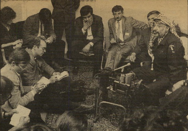
ערפאת במסיבת-העיתונאים למה ציפו העיתונאים?

והדבר השני: אני רוצה לקחת איתי שני קורבנות של האינתיפאדה — יהודי ופלסטיני — לשבועיים לניו-יורק,