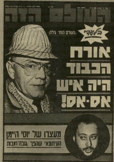
שער הגיליון האחרון סנסציה בגרמניה, ציניות בישראל

רווח כי ראש-העירייה, גונטר זאמטלבה, עומד לכנס את מועצת-העירייה שלו כדי להודיע על התפטרותו. טוכניות-הידריות עמדו במצב-הכח. דובר על מסיבת-עיתונאים סנסציונית. אך בינת-