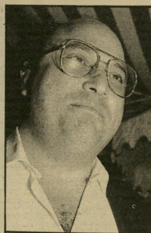
בעל-חברה חכמי ההליכים ומשכים

הקבלנים הרמתי-גנינים ציפורי-אפל 10 קנו לפני שנה בניין ישן בפנינת נח-מני-אחרי-העם בתל-אביב, כסכום של 1.5 מיליון דולר. הם שיפצו אותו כחצי מיליון דולר, ועתה השכירו אותו לבוק הפונונים, המשלם 35 אלף דולר חודר רש, שהם 420 אלף דולר לשנה. בחמש שנים יכסו הרי-השכירות את ההשקעה.