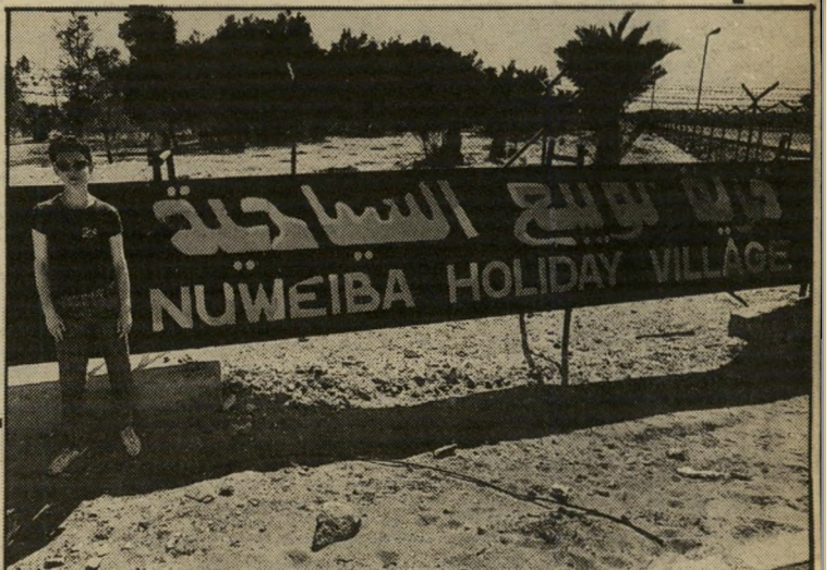
שרה ליבוביץ בכניסה לכפר החניניות הזוהרת ועלמה