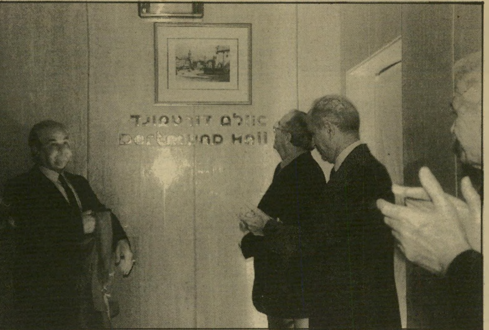
אלרואי זאמטלבה בטכס חנוכת אולם דורטמונד, ונרבקתי בשימחה ובהתלהבות של האידאולוגיה הנאצית.

דיעה הממה קומץ ישראלים כגלל סיבה פשוטה, שהניארנאציי לא ידע אותה: שבאותה עת עצמה היה זאמטלבה בישראל. ולא סתם כתייר מדומן, אלא כאורח-כבוד של עיריית-