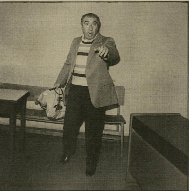
אלי: דמות העולם הזה

קבענו עור מגרשה בקפה ריצה בפרישמון. איחרתי לפגוש. באתי