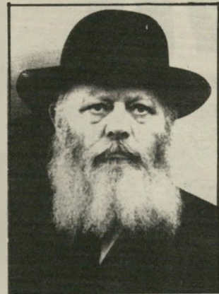
הרבי מלובאביץ' את חיבתו להאמין ליה

ייתיי מעורב ביהדות, במדינת-ישראל, אשתי התגיירה ויש לנו שלושה ילדים. אם ישראל אומרת לי: אשתך לא יהי ריה, ילדיך לא יהודים! או אני מפקפק בכלל בקשר שלי עם ישראל." מוסיף ג'ק שטיין: מה שלא מבינים