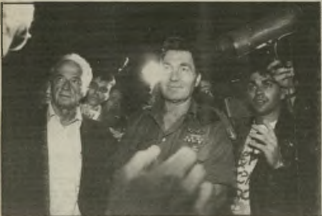
רבין (עם הרמטכ"ל) בנמלהתעופה הדוגמה של מעלות?

הדוגמה של מעלות. הסובייטים, ששיטותיהם היו במשך שלושה דורות שם נרדף לברוטאליות, התנהגו הפעם כהומאניות ובחוכמה. הם הביאו לשחרור כל הילדים החטופים, ובסופו של דבר קיבלו בחזרה את המטוס, הכסף, החוטפים ובני הערובה, כל זה