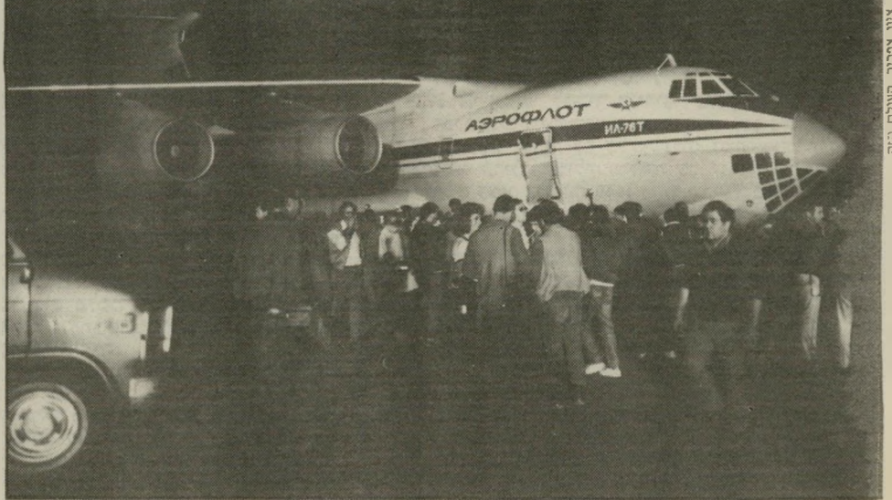
המטוס הסובייטי מאיפה בא להם השכל?

ואכן, התגובה הישראלית הציגה את התכונות החיוביות ביותר של האופי