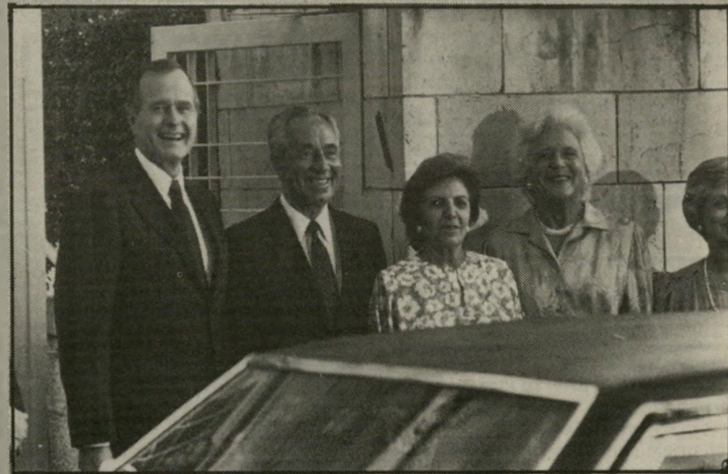
ג'ורג' וברברה בוש עם סוניה ושימרון פרס באוגוסט 1986 , באור אחר לנמר...

אילו היינו אמריקאים לא-יהודיים, אך זה היה נראה לנו? אינני מעלה את השאלה הזאת ככדרך אגב, בגלל בוס... אני מעלה את השאלה מפני שטמונה בה, לדעתי, אזהרה חמורה לגבי העתיד. ...אני חושש מפני היום שבו יקום הציבור האמריקאי הלא-יהודי ויצעק: ריז זה לא יכול להימשך!