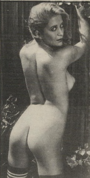
מין סטנדרטי חוץ מזה, הלקאות וכבלים

הגברים אמנם מקופחים, אבל לא לגמרי. יש שלושה דמויי-חי. הראשון: איבר-מין נקבי, בסכום סימלי של 120 שקלים. מחברים לתקע והופ, זה מתחיל לרטוט. כששואלים את יעקובי אם הפי-