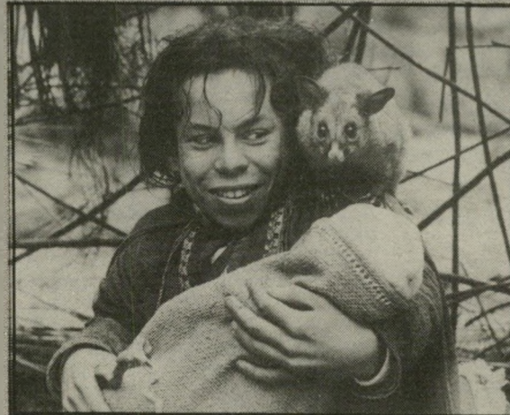
וורוויק דיוויס: גמד רחום וחנון

לעניין את המבוגרים, אפשר רק לומר שאותם הילדים, אשר לא יתקמו בסיטוים במחצית השעה האחרונה של הסרט, שייכים בוודאי לגזע קטוח חדש, הרואה מדי בוקר את מגרש השדים ואוכל ארוחת-ערב עם הרוזן דראקולה.