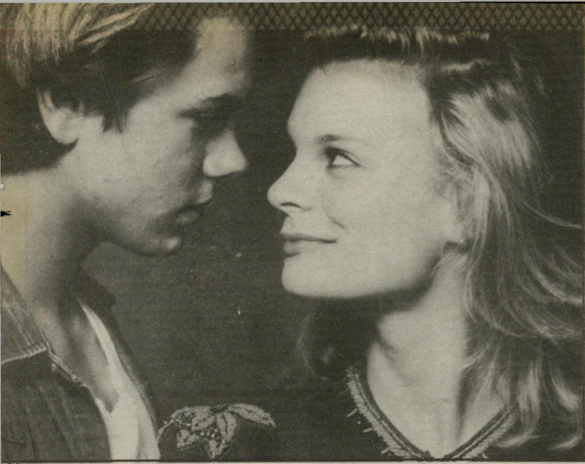
שחקנים מארתה פלימפטון וריבר פניקס בין וודי אן לסידיני לומט

ולתעודת-הבגרות הסופית, אם מדובר ביוקרה קולנועית, היא מופיעה כבתה של ג'ינה רולאנדרס,