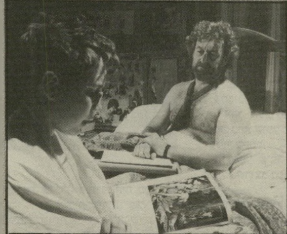
ברנארד היל וגייסון אדוארדס: מתחילים

הרופס הזה בימינו. בעיקבותיהם של שלושת הגברים הולכים גם הפאטולוג (בר-נארד היל) המקווה לחסדיה של סיס, ובנו (גייסון אדוארדס) המקטלג כל מיקרה מוות ואסון הנקרה בדרכו. מי שמוכן לטרוח ולפענח את כל הסמלים, הקשר ביניהם ומיקצמו של כל אחד, בוודאי יהנה מאוד. אבל גם בלי להעמיק חקר יש ממה ליהנות. זהו סרט מבריק, מצולם ומשוחק בצורה מופתית, כשכל תמונה ותמונה היא מלאכת-מחשבת ארוגה.