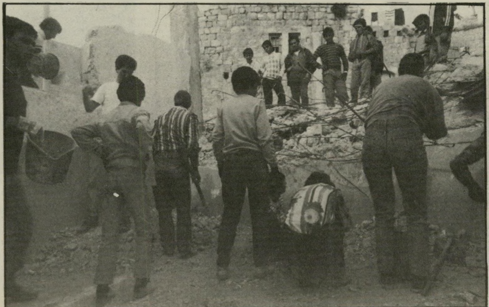
אנשי-הוועד עובדים, בנייהמקום תוהים וכי מדוע שיתחורשו?