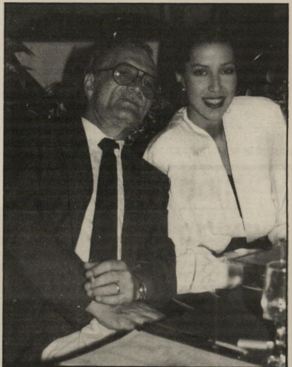
ג'ורג'ין דנילו הבימאי הרוסי (משמאל), שזכה בפרס"סתי", הגיע ארצה כדי להכין את אדריאנה צילום לסירטו „מרתון הצפור". המלונאי איתו היה אירח אחר. אלתו. בין אנשי"הגומניא הצרפת היוונית צרפת אלקטרה (לצדו).

■ הומר בוני שרעבי , ש"הופיע איתה בכמה שירים, נעלב מאוד כשאחד מכתבי־הבידור כתב למחרת ההופעה שהוא, בר"עו שרעבי, צעק בהופעתו על