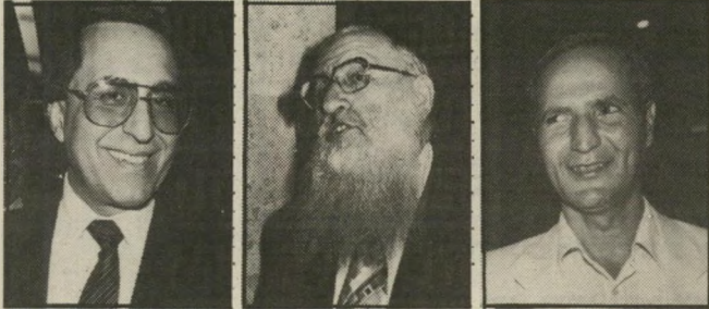
אררי, פרש, שחל. העלית את סחיר הרתיים לאין שיעורו.

למרבית-הפלא, רק ארבעה מהמשתתפים סלרו מההתחייבות. היו אלה יצחק נבון, גר יעקובי, יעקב צור ומד"כ ליהמיפלגה, עוזי ברעם. השאר הצביעו בהתלהבות כער. עוז וייצמן ומר טה גור הפתיעו באומרים: "זה בכלל לא חשוב! אנחנו לא מוותרים על מייודע מה... לעומתם, נזעקו צור ויעקובי והתריעו בחומרה: "זהו מישגה לאומי"!