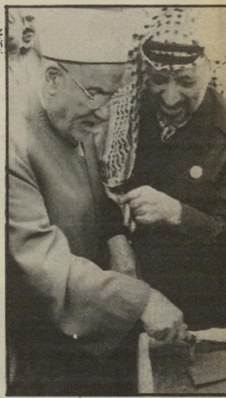
ערפאת באלג'יר כסו ארלוורוב

אלם כל המחסמים והעוכבים ה- אלה אינם אלא זמניים. הסרות העצמאות, אף שאינה אלא צידוף של מלים, שינתה את המציאות מן היסוד. במציאות הפוליטית יש ה- שיבות מסרעת לנתונים פסיר- כולגיים. ההכרזה הזאת היא נתון פסיכולוגי הנובע מן ה- עוברת המשמיע על העובי- דות. האינתיפאדה תימשך. היא תקבל