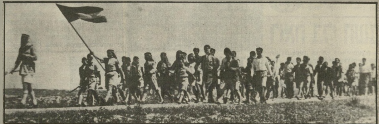
רגל פלסטיני ב-1946 (של תנועת-הנוער אל-ג'אדדה, שהתנגדה למופת) דוג אש"ף, דור שלם לפני לידת אש"ף

אחרי ה"מתבלים" באו "ההדה", שומרון וח"ב-ל"ע, "י"ש וי"ע". השימוש במושגים אלה בא, כמוכנן, לפלס את הדרך לסיפוח, או לפחות לכיבוש ניצח. הדבקות השמות העבריים לשטחים אלה נועדה למנוע כל אפשרות של מחשבה על ההסתלקות מהם. לתוך מלכות זאת נפלו גם רוב העיתונאים ה"חופשיים", המערך, אירגוני-שלום ומפלגות-שלום למיניהם. גם הם נפלו קורכן לשיטת-המוח. כולם החלו מדברים על "יהודה ושומרון", ובכך בלעו את הפיתיון המילולי ונתלו בכתב. כאותו הזמן נולד גם השימוש במושג "רגל אש"ף", כשהכוונה לרגל הלאומי הפלסטיני אשר נולד ב-1917 או ב-1918, כמעט 50 שנה לפני לידת אש"ף. אם זהו רגל אש"ף, כלומר רגל המד