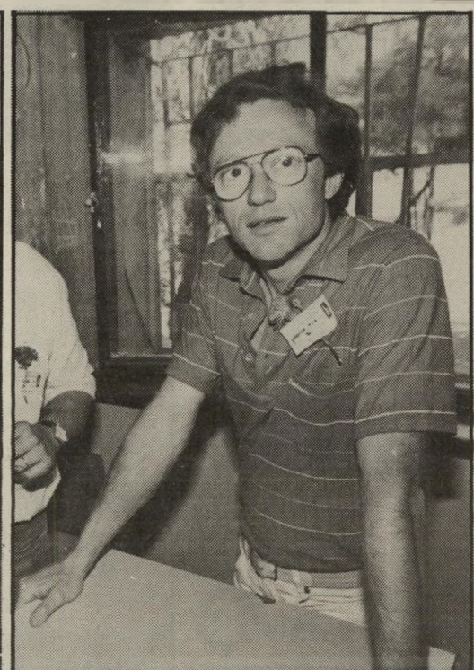
מתפטר-מופטר גרוסמן לא, נדה, לא, נדה מערבית

ישראל, אשר נמצאים בשליטת מדינת-ישראל מאז יוני 1967. ● הוועדה-המנהל מחליט כי עובדי רשות-השידור לא ישתמשו בשידורי רדיו וטלוויזיה, בעברית, וזולת בציטוט ישיר מדיברי אחרים, במונחים "גדה" ו"גדה-המערבית". ● במטרה להבטיח כי רשות-השידור לא תשתמש בימה לתעמולה של גורמים העויינים כמוצהר את מדינת-ישראל והלוחמים נגדה (אש"ף) הוא גורם רם כזה, מטל הוועדה-המנהל על מני כלי-הרשות לברוק, על-פי העקרונות הנ"ל, כל ראיון יזום מיהודה, שומרון