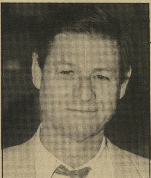
חיים יבין אפור דהוי

● רצוי להופיע בכגדים אופנתיים, ולפחות לחדש את המילתחה אחת לכל חמש שנים. ● חולצות לבנות נראות תמיד טוב. ● עניבות עבות וסרוגות יצאו כבר מזמן מן האופנה. עניבות דקות, בעלות הרפס פירחוני בגוונים אדומים אפשר לשלב עם מיקטורנים בצבעים כהים — שחור, כחול-כהה וחום, וגם עם צבעים בהירים כמו החאקי והביז'. העניבה צריכה להיות ענובה עד לחגורה — זה נותן אשליה של מראה מאורך — וכך גם רוה יותר.