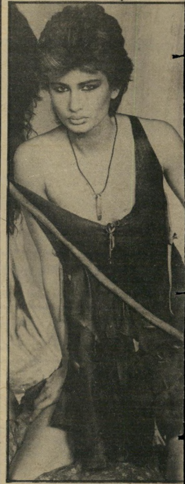
דוגמנית קלצ'ינסקי מצטלמת טוב

וכמו שקורה אצל רבים, גם שהותו של ביל שפירא כאמריקה התארכה והתארכה. פתחתי מישרד לתיווך