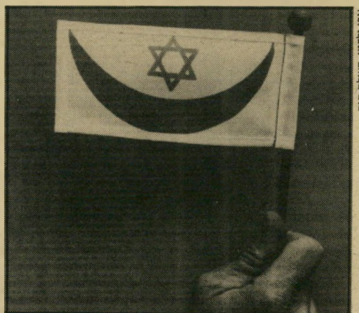
הדגל של הונדרטוואסר

מייד אחרי הטכס הממלכתי הפאתטי לפתיחת יום-השואה, הר פיעה על המירקע קריינית-החדשות, וסיפרה על אשה וקנה כמי חנה-הפלטיים שאטי, שנספתה משאיפת גאז.