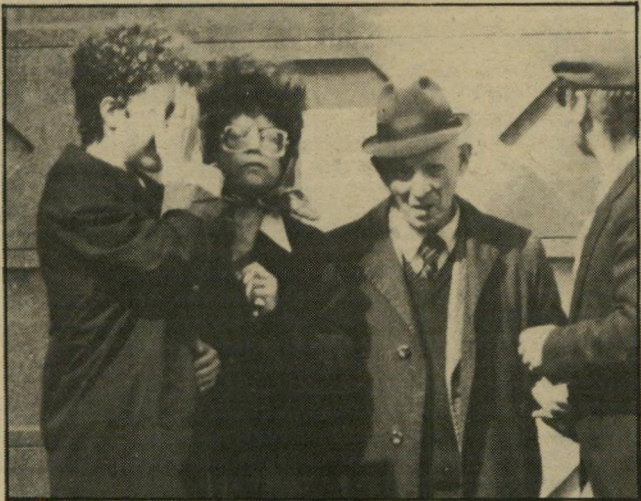
הורי הנרצחת בהלווייה החברים סיאנו להיפרד מהקבר

כנען. הוא קבע זאת מבלי שברק אותו, ומבלי שאף נפגש עימו.