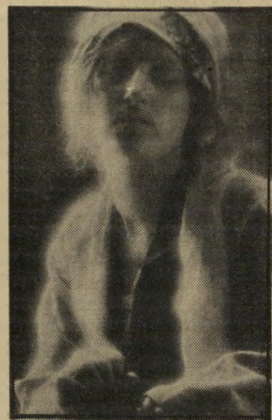
אשה חושנית גוף טוב וראש טוב

"התמונה זה לא אני, אבל היא משקפת את האווירה" היא כותבת. "אשה חושנית ולא פמיניסטית, עם גוף טוב וראש טוב, באמצע ה-30, רוצה גבר חזק באופיו ובגופו, גבוה, משכיל,