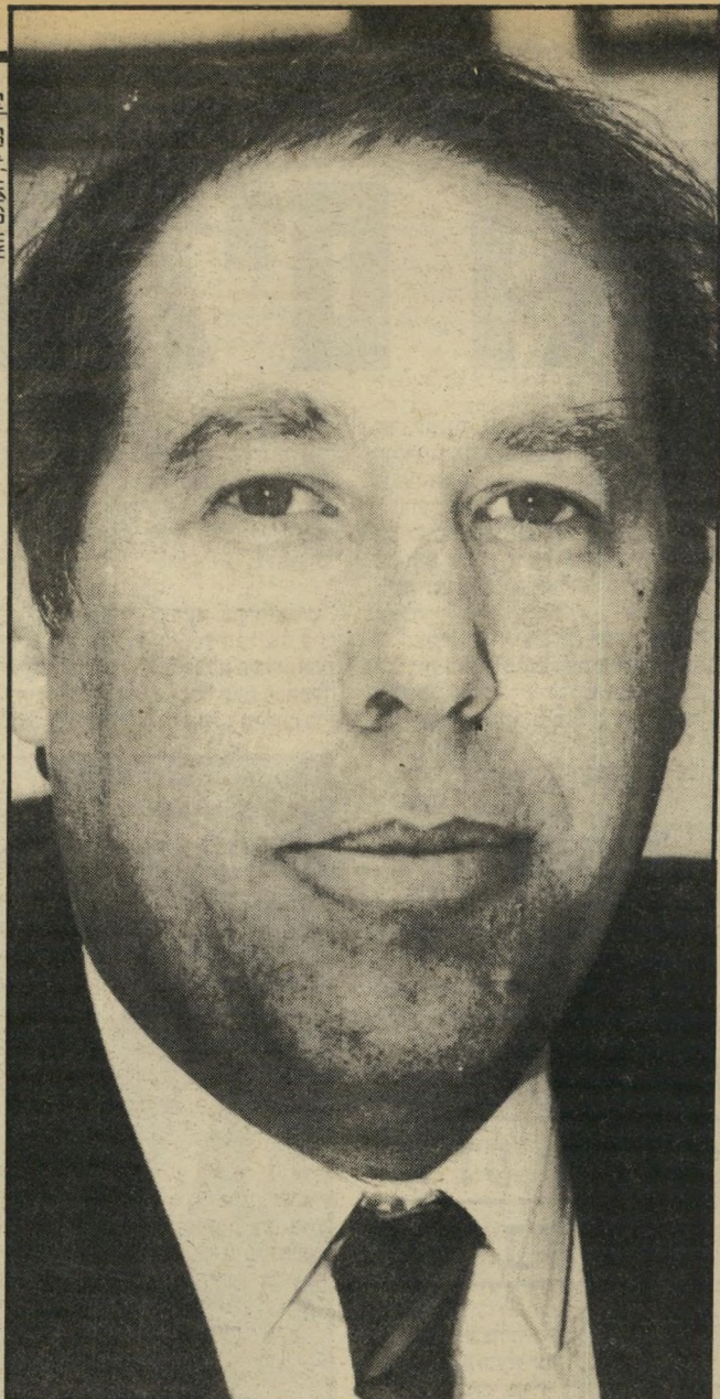
צילום: צפורה העולם הזה

לפי הסביבה — אני סגור. מאז שהתמנתי לנציב, אני יותר זהיר וסגור, כדי שהרברים לא יקבלו משמעות שלא התכוונתי אליה. מיגרעת? אני דוגרי, יותר מדי דוגרי. אני פועל בדיוק כפי שאני מבין, וכך אני גם מדבר. אני לא יודע בדיוק אם זוהי מיגרעת. זוהי הדרך הטובה ביותר. כשאומרים דברים רעים בפנים, זה פחות גרוע מאשר אילו זה נאמר מאחורי הגב. גם עם הפולטיקאים, שאצלם הדוגריות אינה תמיד מקובלת, פיתחת יחסי-אמון מוחלטים: טוב — טוב, רע — רע. ● "לצטייר כנציב שירי על..." הייתי רוצה להצטייר בראיון הזה כנציב שייצל את המערכת, שהפך אותה לפחות מפחידה לגבי הצניור. נציב שהפך את המערכת מפחידה רק לגבי אנשים לא-הגונים. כפי שהדמות שלי תצטייר, זה אולי ישפיע על הדימוי של המערכת. חשוב לי שידעו שקיימת כיום הרמוניה בנציבות-המס: אנשים מפרגים נים זה לזה. המנהלה היום צעירה יותר. הגיל הממוצע שם הוא 40. כן, הגיל שלי.