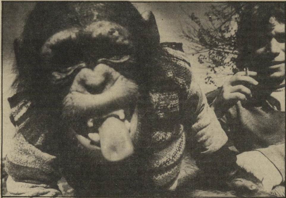
צירלי עם דובי להוציא לשון לכל אחד

בחיך שופע הוא מבהיר: "אני משתדל ללמד את גי'ני פעולות, שיש לה מוטיבציה לעשותן, כמו נסיעה באופניים או סקט-בורד (גלגליות), או מוזיגת משקה לתוך כוס ושתית המשי-קה בכוחות עצמה. אף פעם אחת איני צריך לצעוק עליה, כרי שהיא תיסע באופניים. זה מתכון חשוב להצלחה