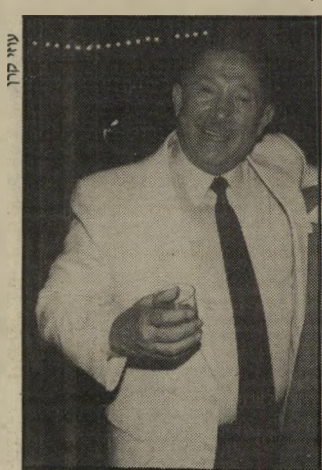
איש-עסקים עינב, משאומתן

המכירה לאמ"ל נועדה להקטין את חובה של בנק הפועלים. הבעיה של אמ"ל היא ששערי מניותיה הם נמוכים מאוד עתה, מתחת לשני דולר המניה, ואם תרצה לשלם לכור במניות, תצטרך להנפיק כמות גדולה של מניות, דבר שיועזע את מערך-השליטה בחברה.