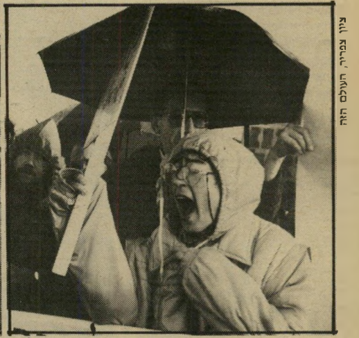
מפגינת "יש גבול" ואבי פרתן ליד מחסום ארו. שילחו את החיילים הביתו