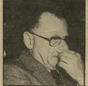
ראשי'טוריה גוראל — 25 מיליון ש"ח לתושבים? בבניין פעל בתיכנסת במשך 25 שנה. עתה הוא נסגר.

הגרם העיקרי בתחום זה היא חברת ביי'טול, המנפיקה עם ישראל'כרם את כרטיס הדלקות, המשותף לבנק הפור' ערים ולחברת סונוול. המחזיק בכרטיס מחוייב בתשלום אחת לחודש, והוא נהנה מהטבות שונות, כמנוי בחברת שנויר בתנאים מיוחדים, והנחות ניכ' רות בתחנות סונוול או ברחיצת המי' כונית בהן.