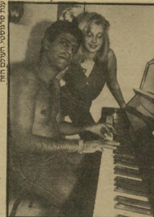
שימי ואשתו גניפור עצבים

בעיתון חדשות מופיעים מרי יום שישי ציטוטים קטנים של אנשים