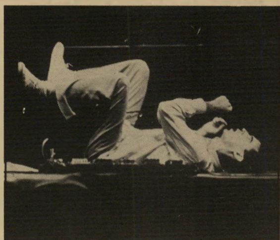
דייוויד בירן: קפדנות עילאית

גם להקשיב למילים, ומי שצורח ללא הפסק, נוסח מעריצי בוי ג'ורג' לדוגמה, יכול לשמוע רק את עצמו.