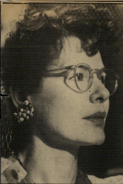
שחקנית יוסט בסרט "ימי הרדיו" רוצה ילד

לצלם הכל מחדש. כמה מן השחקנים, כולל סם שפארד, נאלצו לעזוב, כי היו להם התחייבויות אחרות. אבל מי שנשאר — כולל אותי, שעברתי באותה תקופה על מחזה חדש — עבר כפרך. וודי היה מבין וסבלן ושיחרר אותי לחזרות בכל יום אחרייהצהריים.