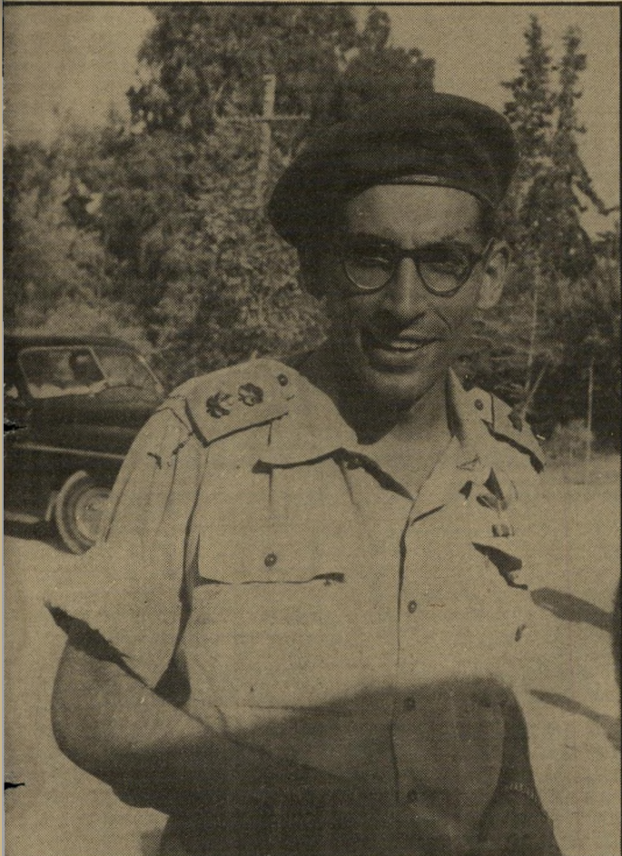
סגן-אלוף זאבי (1954) בגופו של האו"ם, כמעט מילחמה

אלו קם ראש מוסד תרבותי חשוב של עיריית ניו-יורק, גנרל בדימוס של הצבא האמריקאי והציע פומבית לגרש שני מיליון יהודים מארצות-הבית "מכיוון שקלטנו מיליוני מהגרים אחרים". היה העולם עומד על ראשו. ראש-העיריה, אדורד קוק, היה מ' עיף את האלופי-כדימוס כמו טיל. יהודי ארצות-הבית והעולם היו וועקים ח' מס. הכל היו מדעועים מגילוי מחריר זה של אנטי-שמיות ניאורנאצית. השבוע הכריז האלופי רחבעם (גנדי) זאבי, בכינוס פומבי, שיש לגרש מן הארץ מיליון ורבע פלסטינים. תושבי יהודה, השומרון ועזה. איש לא התרגש. כמה פוליטיקאים מיהרו לפרסם פסקי-תגובה. כמה אירגונים פירסמו מחאות. ראש-העיריה, שלמה להט, מע' סיקו של גנדי ופטרונו, אמר בסלחנות שלכל אדם הזכות להשמיע את דעתו הכנה. רעיון ברבארי גנדי דיבר, בעדינות, על טראגי-ספר ("העברה"). אחרי שפורטמו הדברים, ניסה להסביר את דבריו. הדברים היו גרועים מן הדברים המקריים. טען גנדי: הוא למד זאת מאבות תנ"ך