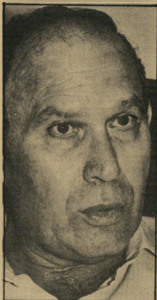
ראש-עירייה תבורי בביתו. הרגליית-זננה...

כבר בילדות. כשהיית בת 7 התחילה להשמין. "אז התחלתי להתפתח לצדדים. עוד לא הייתי ממש שמנה, אבל הייתי מלאה ונראיתי גדולה בהרבה מהילדים האחרים. בכיתה לא סבלתי מהטחנות-עלכונות דווקא בגלל הגודל. פחדו להעליב אותי, כי ידעו שמי שיעז להרגיז אותי יקבל מכות. לפחות זה היתרון של שמנים בחברת ילדים. לא צוחקים עליהם. בגלל הכוח. "הסיבות לכך שהתחלתי להשמין? אצלנו בבית אין הרגלי תזונה. אין ארוזחות מסודרות. מי שרעב, פותח את המקרר ואוכל. חוץ מזה, יש עוד סיבה. ההשמנה זה עניין תורשתי אצלנו כי מישפחה. שני האחים הגדולים שלי היו גם הם שמנים מאוד, אבל עכשיו הם עשו דיאטה, ואני הכי כבדה במישפחה."