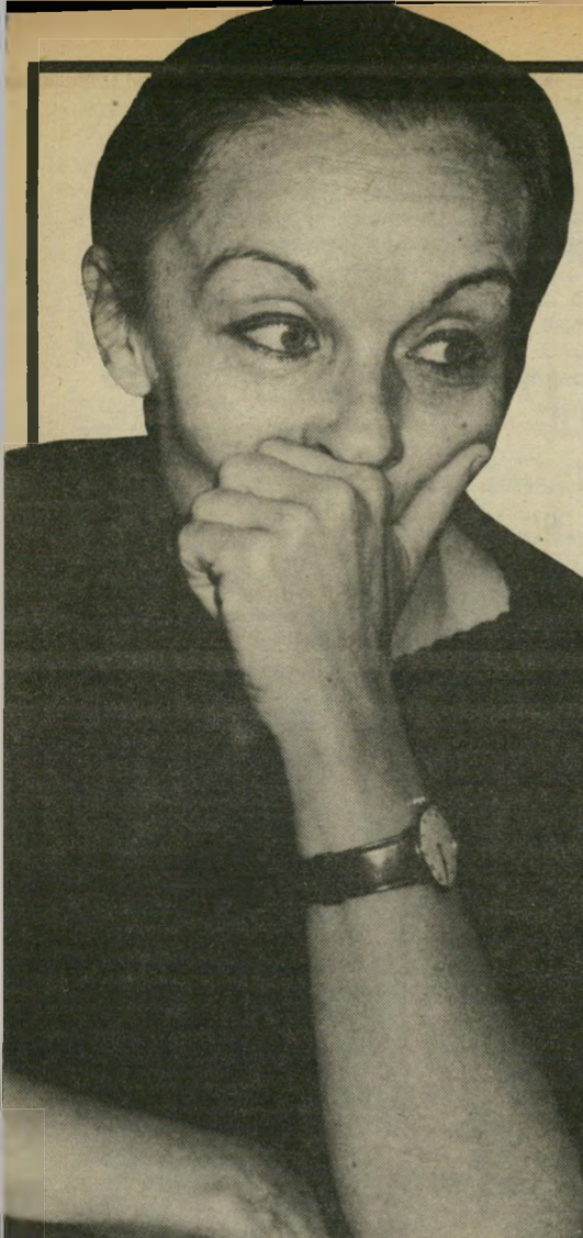
אסירה יערי גירסות בלי סוף