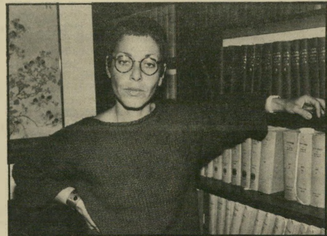
סרקליטה חנוך עדיין מעיינת

חנוך היא סניגורית ותיקה. היא אי-שה קטנה ואמיצה, הידועה כמי שנלח-מה חזק עבור לקוחותיה. יערי האיצה בה לעבור על החומר בתיק ולראות אם יש מקום להשתמש בתצהירה של אנט סקירה בעירעור.