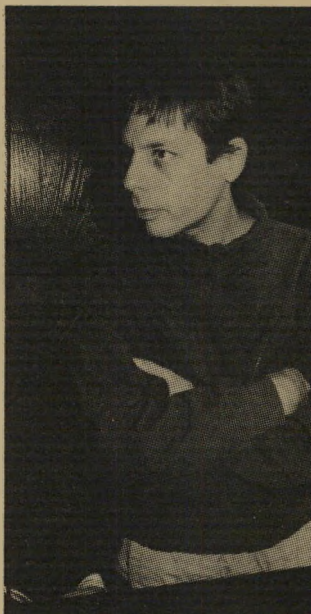
נאשם סוסטר 5000 דולר למאהב

"אין בפי רי מילות-יגנאי כדי להרקי את מעשיהם, חומרתן המופלגת של העבירות. התמכרות לסמים היא מכת-מדינה, וגוררת עבירות נוספות למען השגת הסם." אחרי שהטיל על הנאשמים את העונש המוסכם, ציווה השופט על אורלי לקום ואמר לה כי הוא מקווה שהיא תזכה לפרייבטן, שאליה היא משותקת כל-יך. "אבל אם יהיה לך ילד," אמר השופט, "אני מאחל לך שהוא לא יעמוד לעולם לפני בית-המשפט לדין על עבירות-סמים. אבל אם כן, תוכיח את הופעתך כאן, כמי שנתנה יד להפצת הסם!"